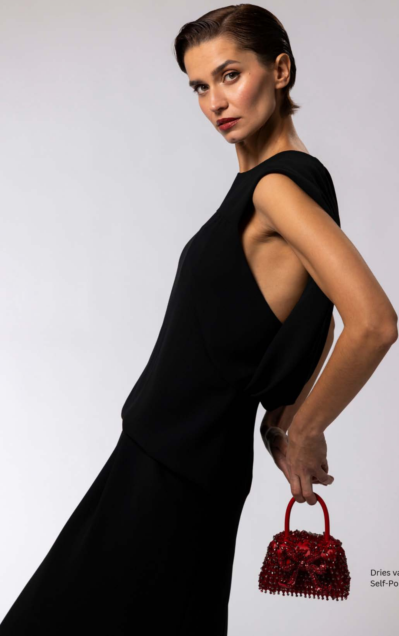
Dries van Noten Self-Portrait