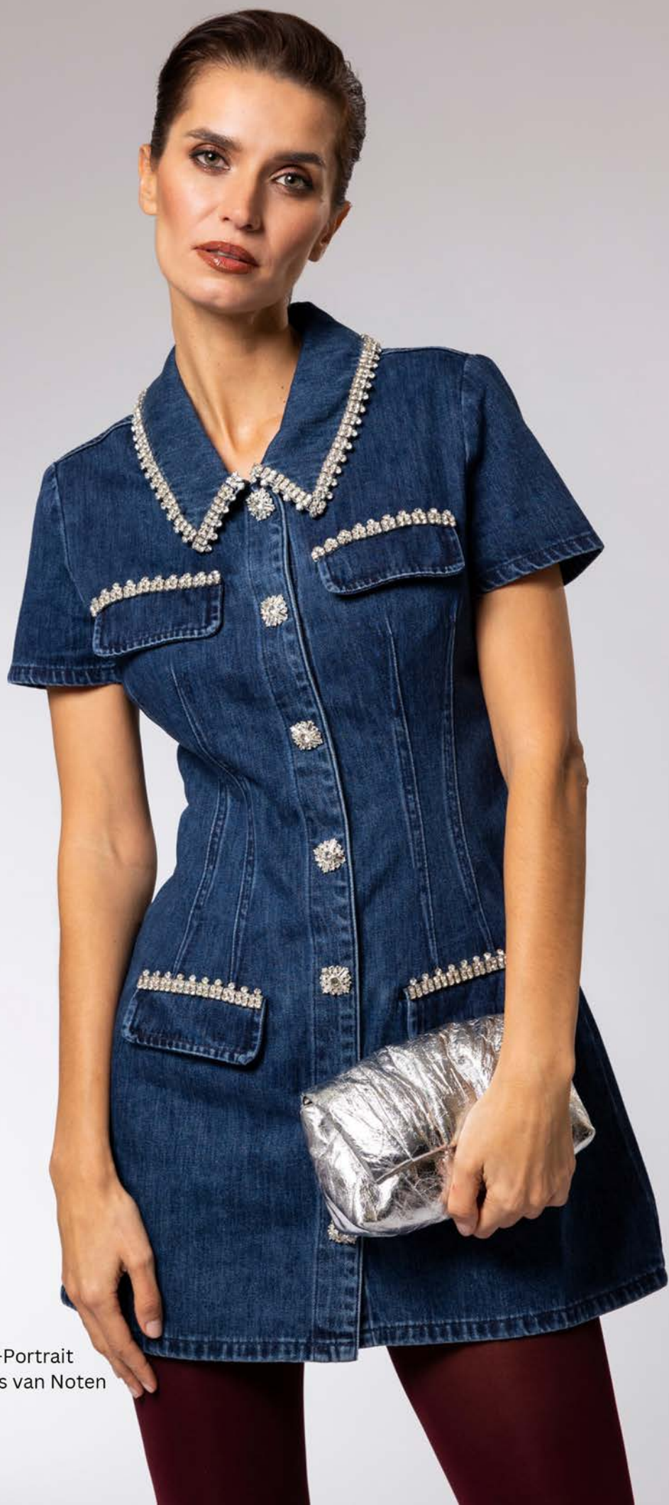
Self-Portrait Dries van Noten